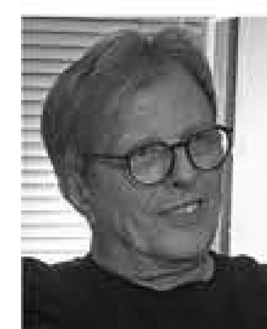
iothar kreutzer schräg und nichts