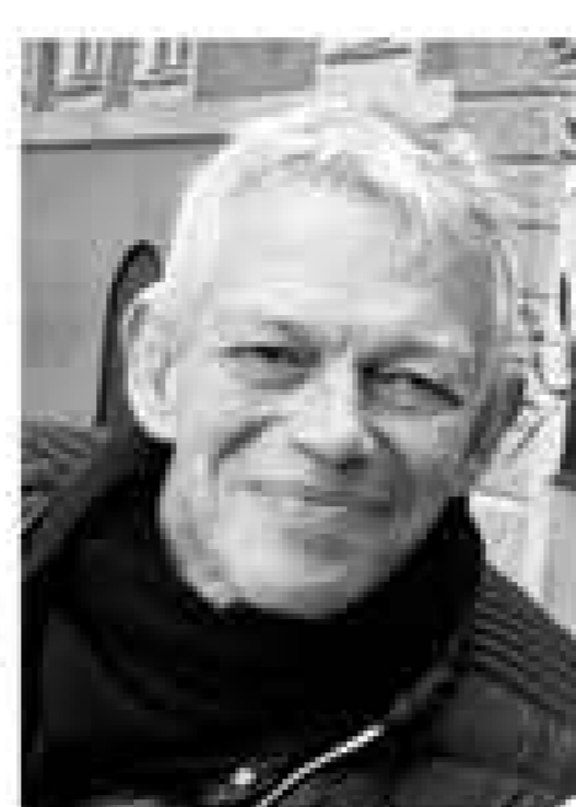
adam volohonsky strand abstract